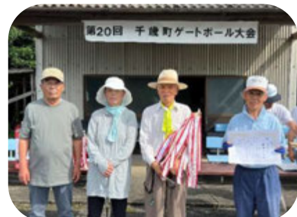
優勝した石田チーム