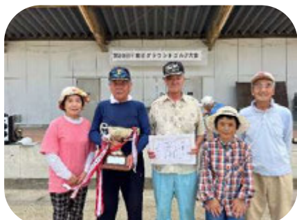
優勝した高畑チーム