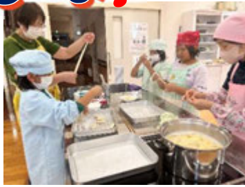
食推協の方の指導で郷土料理の「やせうま」を作りました。