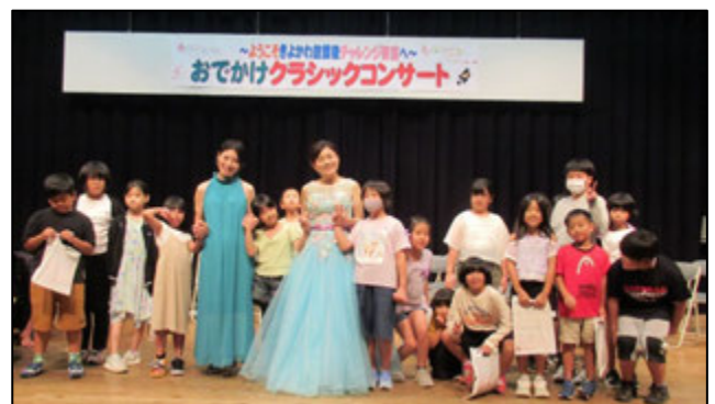
10/2 クラシックコンサート♪