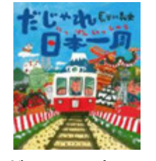
だじゃれ日本一周/ 作 長谷川義史