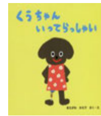
くうちん いってらっしゃい/ さく・ え まえがわ かえで