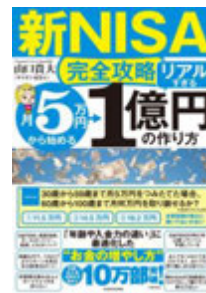
新NISA完全攻略/ 山口貴大