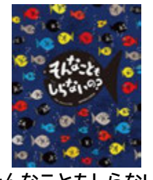
そんなことも知らないの/ 作 パクジョンソプ 訳 なかやま よしゆき