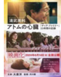
アトム的心脏/ 清武英利