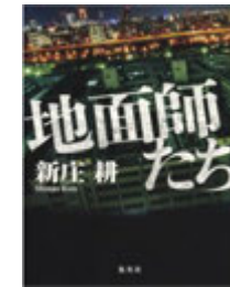
地面師たち/ 新庄耕