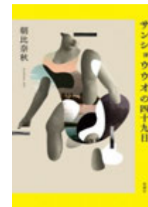
サンショウウオの 四十九日/朝比奈秋