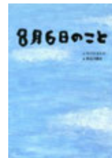
8月6日のこと/ 文中川ひろたか・ 絵 長谷川義史