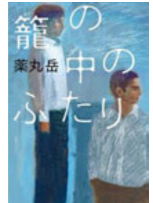
籠の中のふたり/ 薬丸岳