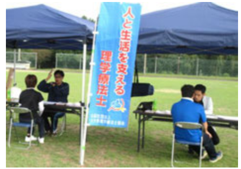
理学療法士さんの健康相談コーナー