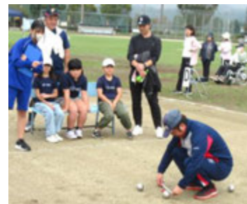
どっちに何点かわかるかな