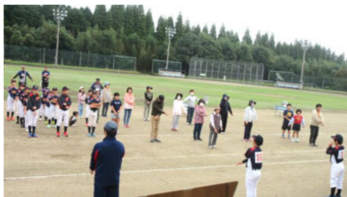
みんなで元気にラジオ体操