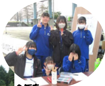
今年も 中学生のボランティアが 大活躍! ありがとう!