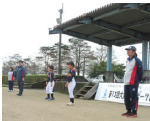
ラジオ体操の指導はスポーツ推進委員と 大野ファイターズ(少年野球)