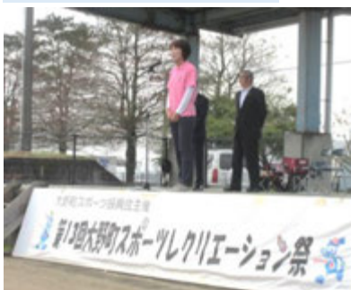
大野町スポーツ振興会 会長あいさつ