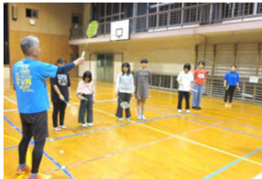
「ラケットのにぎり方はこうです」