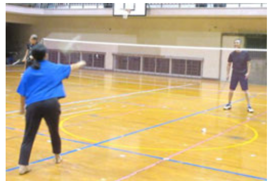
試合形式でやってみましょう!